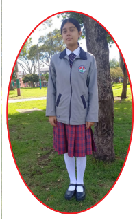
CICLO PREESCOLAR, 1, 2, 3 Y 4