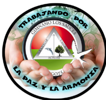
LOGO DE CONVIVENCIA