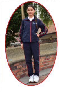
DEPORTE Y DANZAS