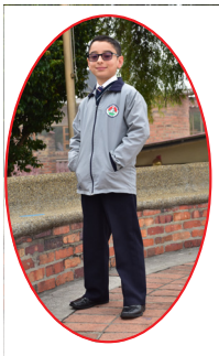
CICLO PREESCOLAR, 1, 2, 3 Y 4